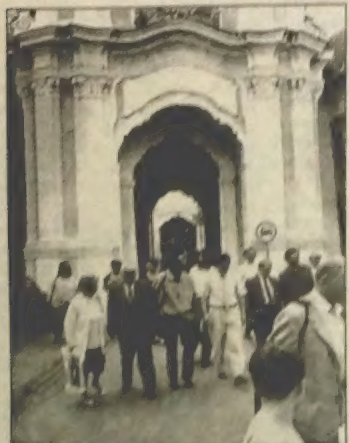
Дэлегаты каля Брамы Базылянскіх муроў

Скончыўся першы працоўны дзень пажытам стужкі «Дзёньнісьць ТБК Літвы», падрыхтаванай ейным старшыняю Х. Нюнькам. А пасьля — цікавая экскурсія па беларускіх